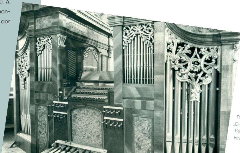
Rekonstruiertes „Dreifaches Visier“