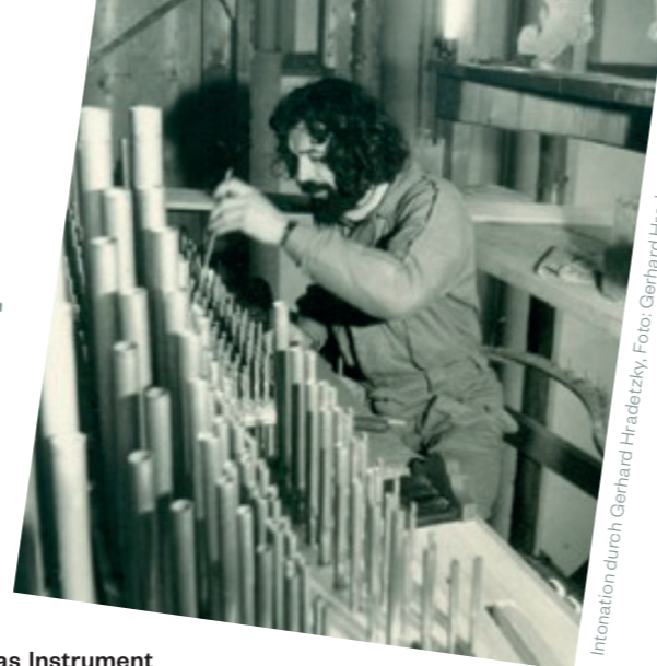
Intonation durch Gerhard Hradetzky, Foto: Gerhard Hradetzky

Viel schwieriger aber war es den authentischen Klang wieder zu finden. Wie hat das Instrument einmal geklungen? Wo waren die originalen Pfeifen geblieben? Wo und wie waren sie platziert? Was wurde alles verändert? Fragen über Fragen. Mir blieb nur eine Wahl, jede einzelne Pfeife (es waren ca. 1800!) musste untersucht werden. Doch ich bekam Hilfe von „oben“. Es stellte sich heraus, dass alle Egedacher-Pfeifen auf das genaueste beschriftet waren! Eigentlich eine kleine Sensation, denn das ist bei originalen Barockpfeifen ganz selten der Fall. Jetzt wusste ich, welche Pfeifen zu restaurieren waren und auch, wo die Pfeifen einmal standen und erklangen. Die fehlenden Pfeifen mussten auf barocke Art nachgebaut und dem restaurierten Bestand klanglich angepasst werden.