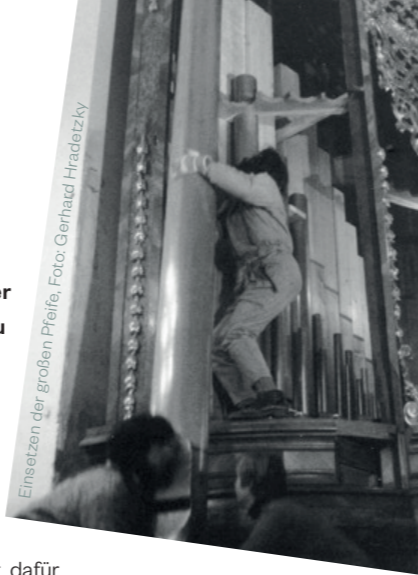
Einsetzen der großen Pfeife, Foto: Gerhard Hradetzky

Ich denke, dass dieses Instrument zu den besten und schönsten seiner Art zählt und ein Zeitdokument von unschätzbarem Wert darstellt. Die umfassende Restaurierung und Rekonstruktion trugen maßgeblich dazu bei. Dieser musikalische Schatz steht dem Festival ZUSAMMENSPIEL zur Verfügung! Und dass meine Firma „Orgelbau Gerhard Hradetzky“ diese Arbeit machen durfte, ist nach wie vor eine große Ehre für mich.