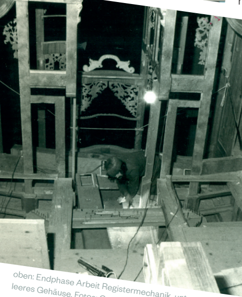
oben: Endphase Arbeit Registermechanik, unten: ausgebauter Orgel leeres Gehäuse